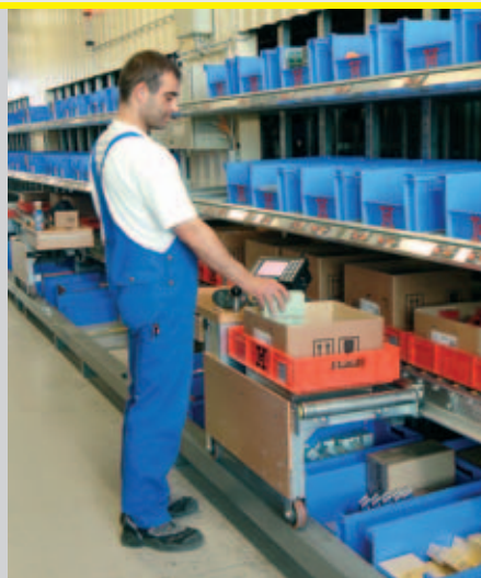
Kommissionierung am Commissioner unter Einsatz einer mobilen Waage zur 100% Kontrolle