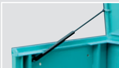
Gasdruckfeder zur Deckelhalterung