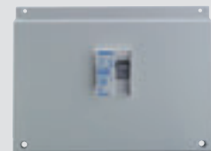
FI-Schutzschalter (2-pol. 25A/0,03A)