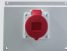
1 x CEE 16A Drehstrom 400 V