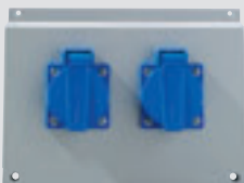
2 x 230 V-Schuko-Steckdose 16A