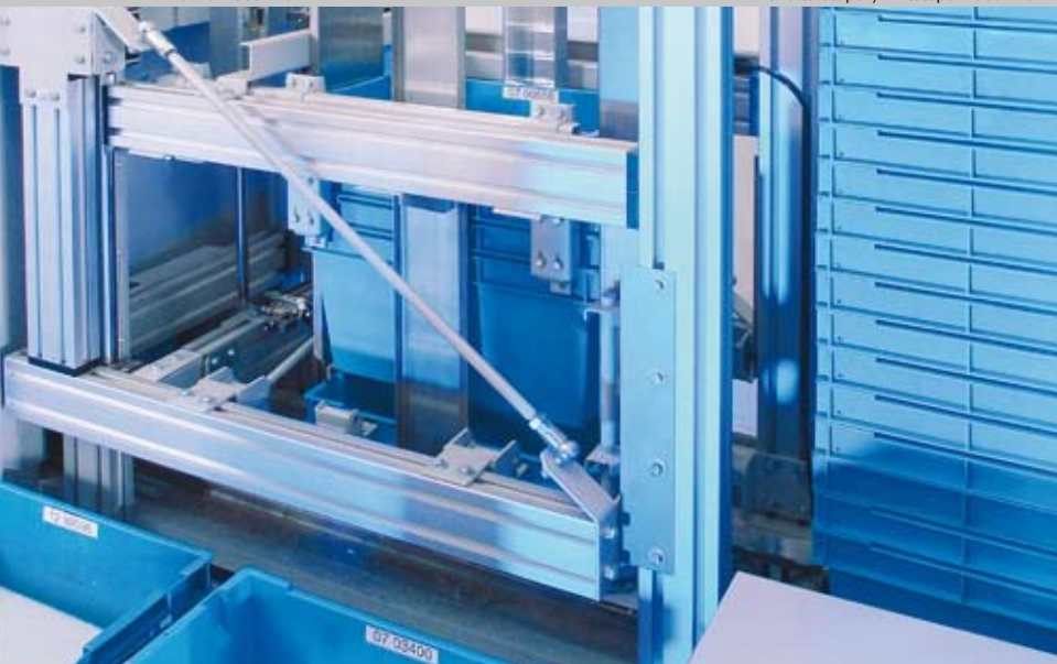
Behälterstapel-/ Entstapelmaschine ▼ ▼