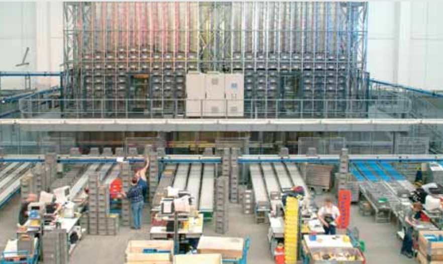
Commissionier mit Kommissionierplätzen