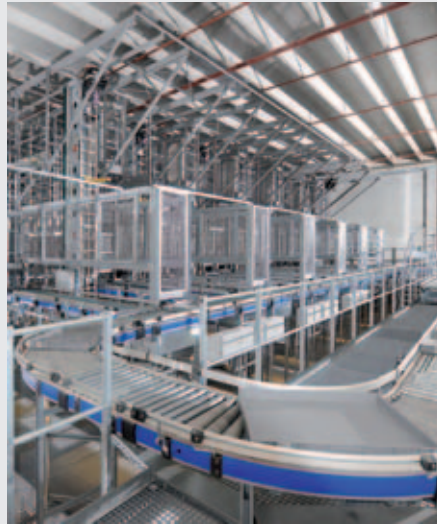
AKL Ein- Auslagerung

Effiziente Systemtechnik sowie eine zukunftsorientierte Anlagen- und Materialflusskonzeption sind die wesentlichen Erfolgsfaktoren bei der Erstellung und Einrichtung moderner Distributionszentren. Beispiel: der dänische Möbelhersteller JYSK, in Deutschland bekannt unter dem Firmennamen Dänisches Bettenlager. Der europäische Marktführer für Artikel im Schlaf-, Bad- und Wohnbereich in Uldum, nördlich von Vejle in Ostjütland, hat sein neues Zentrallager für 170 Shops in Dänemark, Norwegen, England und den Benelux Staaten in Betrieb genommen. Eine Anlage mit riesigen Dimensionen. Mit drei kombinierten Hochregallagern und zwei gekoppelten automatischen Kleinteilelagern entstand dort das mit rund 200 Arbeitsplätzen und 1,43 Millionen Kubikmetern größte Logistikkager Dänemarks. Es wurden vier JYSK Standorte zusammengeführt, um dadurch eine bessere Lieferqualität durch Lagerung und Zugriff auf alle Artikel zu erzielen.