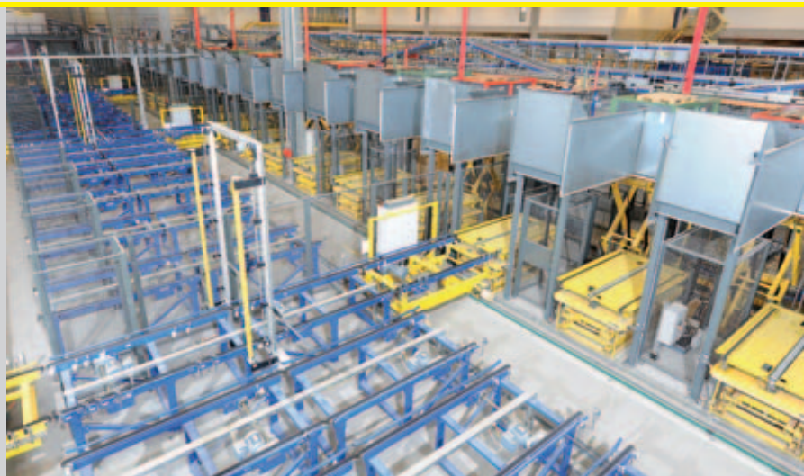
Über Verschiebewagen sind die Hubtische unter der Kommissionierbühne mit der Kettenfördertechnik verbunden