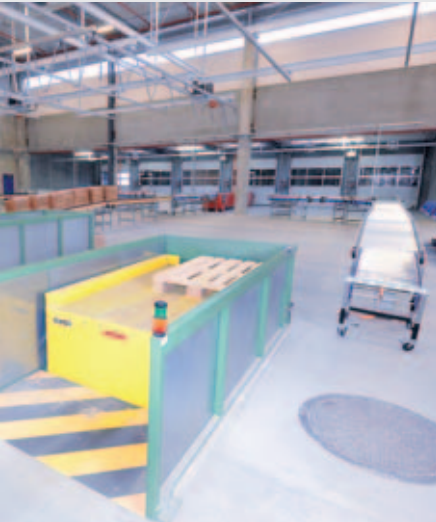
Vakuumlifter, hydraulische Scherenhubtische, Rollen- und Teleskopförderer sind die Ausstattung für ergonomisch gestaltete Arbeitsplätze im Wareneingang.