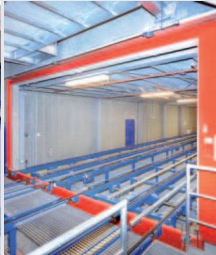
Brandschutztore riegeln im Ernstfall die Förderstrecken zum HRL ab.