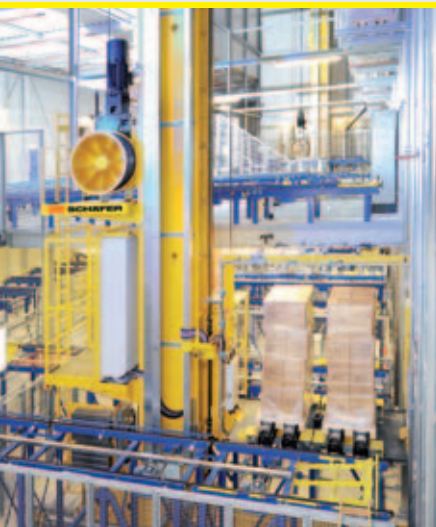
RBG mit vier Teleskopgabeln für gleichzeitige Aufnahme von 2 Euro- oder einer Bigbox-Palette