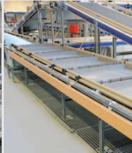
Tablarfördertechnik zu den Kommissionierplätzen