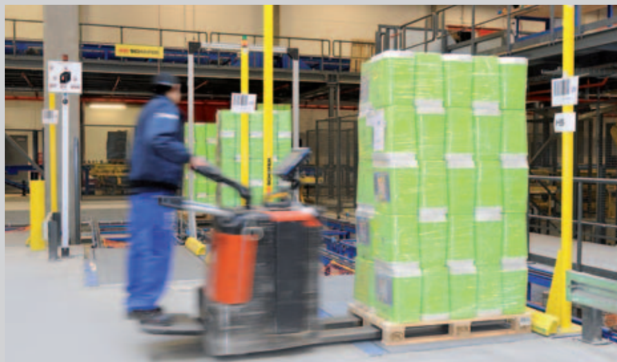
Einer der Haupteinlagerungspunkte zum HRL