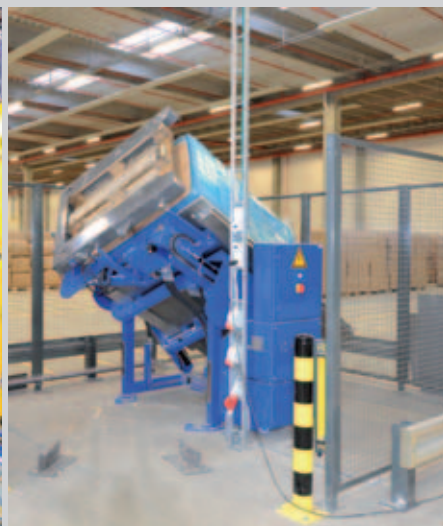
Vollautomatischer Austausch schadhafter Paletten