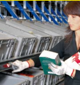
▲ Pick-by-Light Kommissionierplatz ▼ Multi-Light Kommissionierplatz