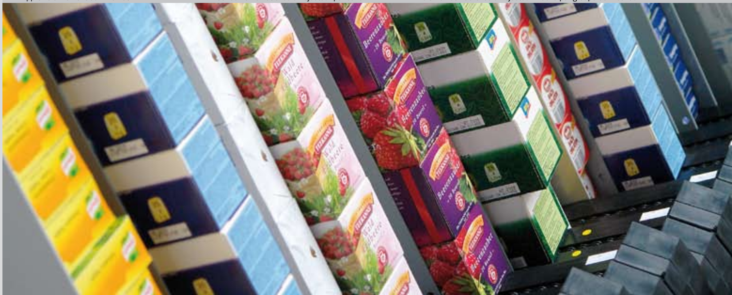
▲ Multi-Pemat ECO avec un éjecteur mobile par groupe de 4 canaux