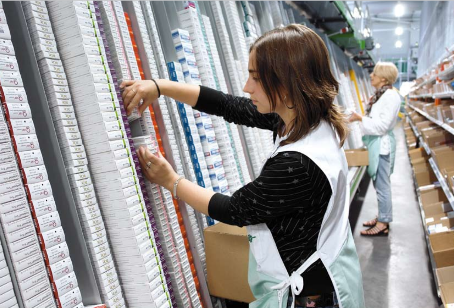
▼ Rangement des articles à l'intérieur des canaux du S-Pemat au design ergonomique